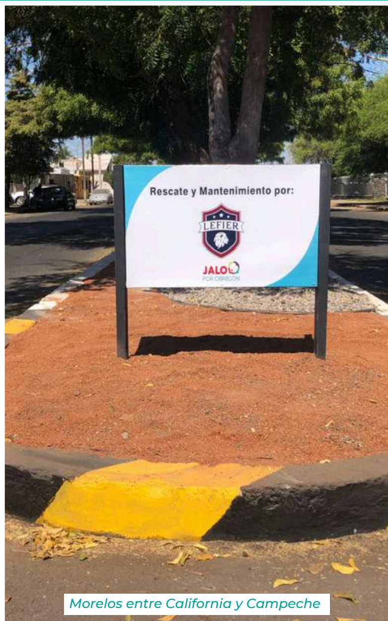
Morelos entre California y Campeche