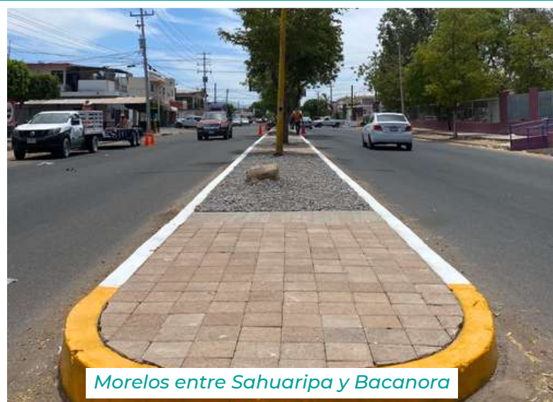
Morelos entre Sahuaripa y Bacanora