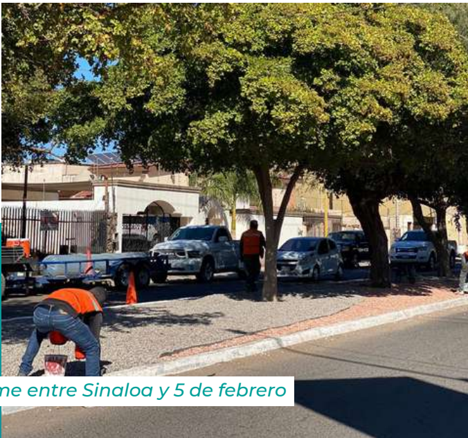
Cajeme entre Sinaloa y 5 de febrero