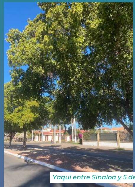
Yaqui entre Sinaloa y 5 de Febrero