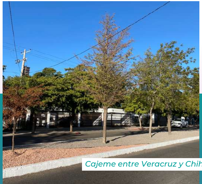
Cajeme entre Veracruz y Chihuahua